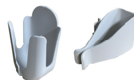
Support souris et Support douchette