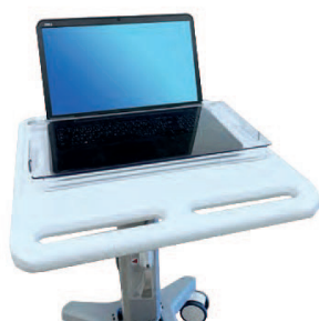
Protection de clavier