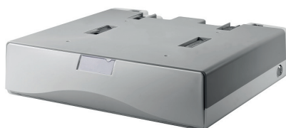
Tiroir simple Option : tiroir pilotable