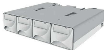
Tiroir 4 bacs Option : tiroir pilotable